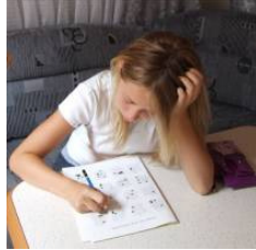
Enfeksiyon nedeniyle kaşınmıyor da olabilirsiniz.

10. ve 35. HAFTALARDA DÜZENLENECEK "BİTTEN ARINMA" HAFTASONLARINA KATILIN