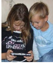
Baş biti baş/saç teması ile geçer.